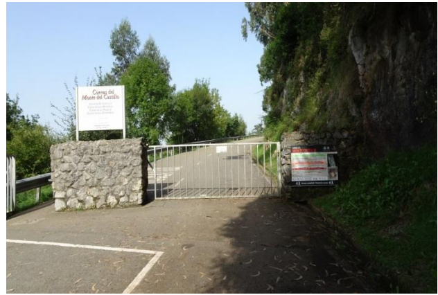
“Cueva de Monte Castillo”

10° giorno 4 agosto 2018 (Santillana del Mar – Fuente Dé – Picos de Europa km 110 + Santillana del Mar km 12,5 in moto e km 6,50 a piedi)