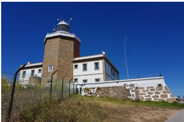
"Faro di Finisterre"

parcheggio, non completamente in piano misto per auto e camper, ma, con un camper < 35 q., possiamo tranquillamente seguire la stradina in discesa sulla sinistra che ci porta su un piazzale, perfettamente in piano, dove è possibile campeggiare (noi abbiamo trovato 7 camper con tendalino e tavolini all'esterno) in questo punto veramente panoramico (GPS= N=42°53'13,90" O=09°16'23,30" m. 45 s.l.m.). "Finisterre" in castigliano e "Fisterre" in galiziano, "Finis Terrae" : la fine della terra, infatti per secoli la terra finiva qui, era l'ultimo bastione dell'"Impero Romano".