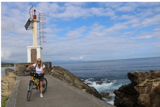
“Punta de la Cruz”

panoramica proprio sopra la spiaggia dove assaporiamo un eccellente “Pulpo a Feira” o Pulpo a la Gallega”.