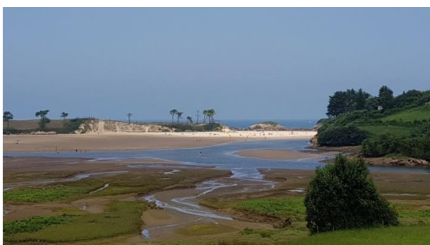
“ Parque Natural de Oyambre ”