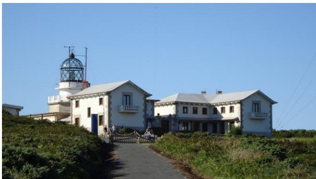
“Faro de Punta Estaca de Bares”

una vecchia costruzione militare, la cui funzione era, alla fine del 19° secolo, la comunicazione con le navi mediante segnali con bandiere, posto di osservazione militare e centro meteorologico.