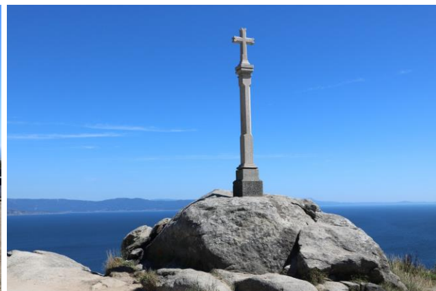
"Finisterre: La Cruz de la Costa de la Morte"