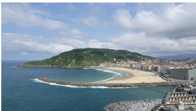
“San Sebastian: Spiaggia La Zuriola”