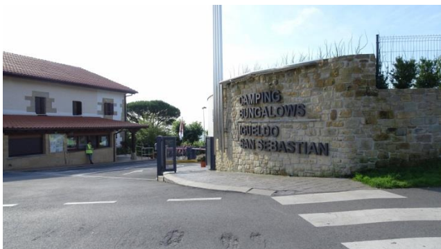
“San Sebastian: Camping Igueldo”

“San Sebastian” (Donostia in basco) www.sansebastianturismo.com è una città decisamente turistica situata sul “Camino de Santiago” e soltanto a 20 chilometri dal confine francese, conta moltissimi alberghi di ogni genere e grado, bar, ristoranti e soprattutto spiagge bellissime. Si estende su una baia di sabbia bianca, tra i “Monti Urgull e Igueldo” . Un nucleo marinaro, una zona signorile e quartieri moderni rendono questa città una delle più belle del litorale cantabrico. La giornata inizia con temperature molto basse, ma tempo bello: 15 gradi alle 7,00! Alle 9,00, in sella al nostro scooter scendiamo verso la città, ma sulla strada troviamo la deviazione per il “Monte Igueldo” www.monteigueldo.es , quindi saliamo in cima. Per entrare (è possibile l'accesso anche ai camper < 35 q.), c'è da pagare un ticket di ingresso che consente anche il parcheggio (GPS= N=43°19'13,10" O=02°00'38,30" m. 170 s.l.m.) del mezzo (€ 2,30 a persona).