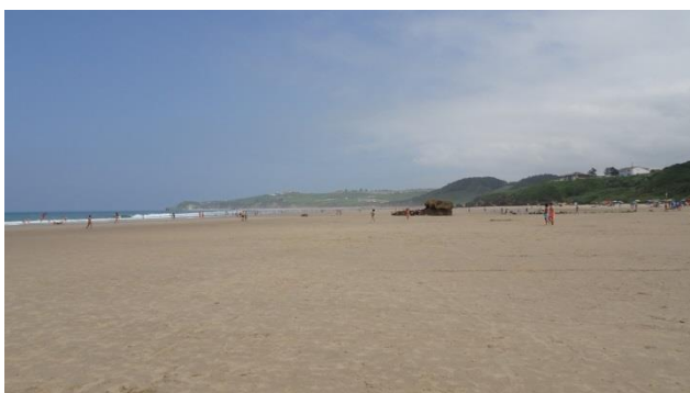
“ San Vicente de la Barquera: Iglesia de la Virgen de la Barquera & la Playa de Meron ”