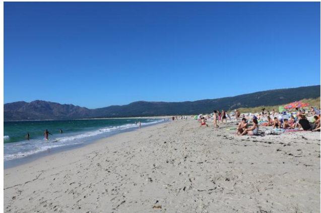
“Carnota: Playa de Carnota”

La “Playa de Carnota” ( un'altra tra le 5 spiagge più belle di Galizia, sempre secondo la guida del Touring Club Italiano ) è tra le 100 migliori al mondo, secondo la rivista tedesca "Traum Strände". Questo è uno degli accessi al parcheggio, ma solo con camper < 35 q.; inoltre è necessario arrivare al mattino prima delle 9,00 altrimenti l'accesso può diventare molto difficoltoso, è inoltre possibile la sosta notturna (GPS= N=42°48'53,50" O=09°06'19,60" m. 0 s.l.m.). Noi siamo costretti a parcheggiare sulla strada ed a percorrere la stradina di accesso a piedi (in parte sterrata) fino al parcheggio e quindi sulla spiaggia davvero lunghissima! Ancora pochi chilometri sempre sulla AC-445 e troviamo l'accesso al “Camping Ancoradoiro” (GPS= N=42°45'27,70" O=09°06'44,40" m. 25 s.l.m.), bel campeggio www.campingancoradoiro.com con annesso area camper con vista sulla spiaggia sottostante, la “Praia de Lanño”.