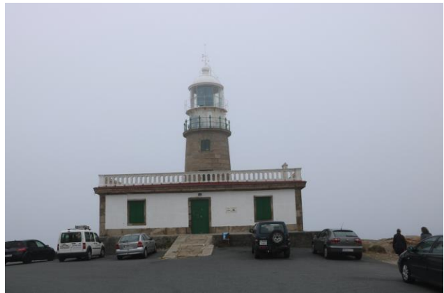
“Corrubedo: il faro”

18° giorno 12 agosto 2018 (Muros – Faro e Dune di Corrubedo – Baiona km 205 + a piedi sulle dune km 5)