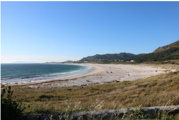
“Lanño: Playa de Lanño”

La “Playa de Carnota” ( un'altra tra le 5 spiagge più belle di Galizia, sempre secondo la guida del Touring Club Italiano ) è tra le 100 migliori al mondo, secondo la rivista tedesca "Traum Strände". Questo è uno degli accessi al parcheggio, ma solo con camper < 35 q.; inoltre è necessario arrivare al mattino prima delle 9,00 altrimenti l'accesso può diventare molto difficoltoso, è inoltre possibile la sosta notturna (GPS= N=42°48'53,50" O=09°06'19,60" m. 0 s.l.m.). Noi siamo costretti a parcheggiare sulla strada ed a percorrere la stradina di accesso a piedi (in parte sterrata) fino al parcheggio e quindi sulla spiaggia davvero lunghissima! Ancora pochi chilometri sempre sulla AC-445 e troviamo l'accesso al “Camping Ancoradoiro” (GPS= N=42°45'27,70" O=09°06'44,40" m. 25 s.l.m.), bel campeggio www.campingancoradoiro.com con annesso area camper con vista sulla spiaggia sottostante, la “Praia de Lanño”.