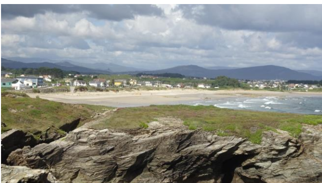
"Playa de Aeralonga"

Ci perdiamo nei meandri di queste cattedrali e scattiamo moltissime foto veramente affascinati da questo spettacolo! Risaliamo dalla scala "controllata" e proseguiamo nella passeggiata sulla passerella panoramica circondati dalle fioriture fino al punto panoramico che ci permette di ammirare anche la " Playa de Aeralonga ". Rientriamo verso il parcheggio, ma decidiamo di scendere (non vogliamo farci mancare nulla!) anche alla " Playa de Esteiro " (GPS= N=43°33'14,40" O=07°08'55,40" m. 0 s.l.m.), una piccola ma graziosa spiaggia situata proprio sotto il parcheggio.