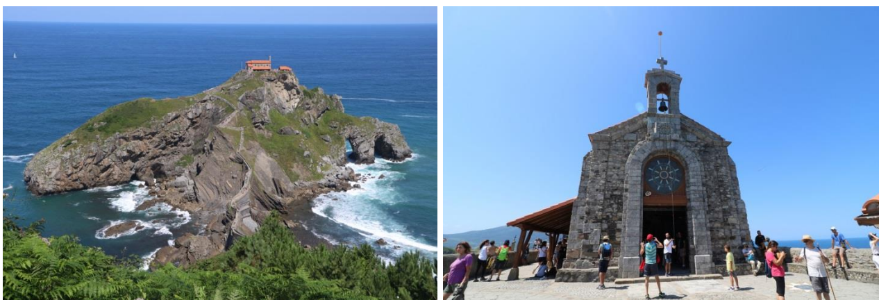
“San Juan de Gaztelugatxe”

Riprendiamo il nostro viaggio seguendo la B-637 che diventa ben presto B-634, uscendo così dalla città. Proseguiamo fino al termine di questa strada ed entriamo nell'autostrada BI-631 (brevissimo tratto, poi rimane BI-631 ma diventa a una corsia) fino ad un incrocio con l'indicazione a sinistra per “ Bakio ” e la strada diventa BI-2101 fino a “ Bakio ”, dove diventa BI-3101. Seguiamo questa strada per circa 15 chilometri fino alla deviazione (indicazione con cartello turistico) per “ Gatzelugatxe ” e troviamo qui subito un primo parcheggio (GPS= N=43°26'21,30" O=02°47'00,00" m. 205 s.l.m.) (bisogna arrivare presto altrimenti i parcheggi si riempiono). Altri parcheggi seguendo la strada a sinistra (GPS= N=43°26'28,50" O=02°47'05,10" m. 190 s.l.m.); non infilarci con i camper sulla strada di destra. Ci avviciniamo all'ingresso del percorso di accesso dove c'è il controllo degli ingressi e ci viene chiesta la prenotazione via internet, ma ci fanno entrare ugualmente, meglio comunque registrarsi al http://web.bizkaia.eus/es/gatzelugatxe#com_liferay_journal_content_web_portlet_JournalContentPortlet_INSTANCE_bDCflaC55OfTbipo_contenedor_pestanias2 .