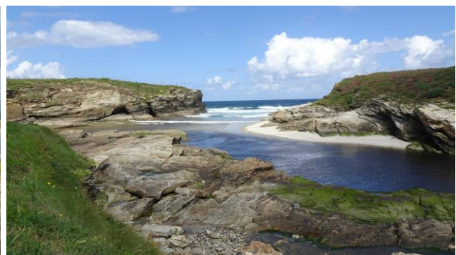
"Playa de Esteiro"

Dopo pranzo ripartiamo in direzione " Viveiro " a circa 60 chilometri verso ovest. Prendiamo subito la A-8 (E-80) in direzione " Villalba " e dopo circa 10 chilometri usciamo e prendiamo la N-642 in direzione " Cangas " e " Viveiro ", fino al punto in cui inizia l'autostrada CG-2.3 che percorriamo completamente (è una bretella che ci permette di evitare un pezzo di strada