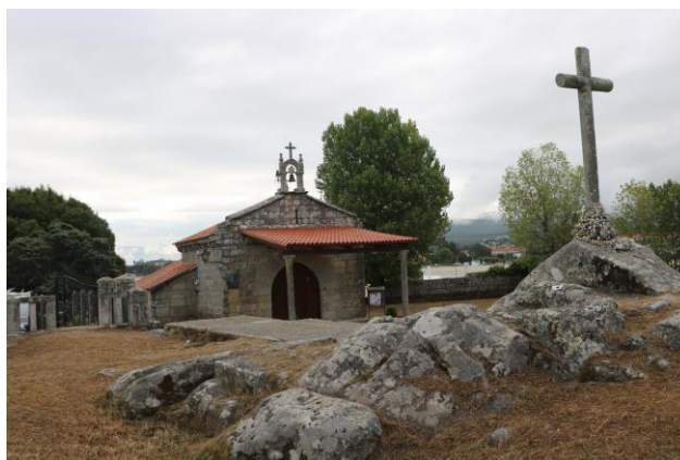
“Baiona: Fortaleza de Monterreal & Chiesa di Santa Marta de Baiña”