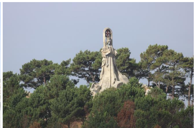
“Baiona: Chiesa di Santa Liberata & Virgen de la Roca sul Monte Sanson”

Terminata la visita della cittadina e prima dell'imbarco, ci fermiamo in una “Churreria – Heladeria” , davanti al castello dove ci gustiamo i “churros” tipici dolci spagnoli, con un cappuccino. Siamo a pochi passi dall'imbarco e sono ormai le 12,00 così ci avviamo al pontile dove è già attraccato il catamarano che ci condurrà in questa avventura. Saliamo a bordo e puntuali salpiamo dirigendo la prua in mare aperto. Passiamo in mezzo a due isolette, sempre