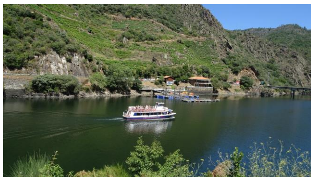
“Canyon do Sil”