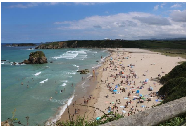
“Playa de Pernarronda”

La giornata, che questa mattina non era delle migliori è diventata bellissima con un sole stupendo. Rientriamo al punto di partenza sulla “ Playa de Arnao ” e andiamo in spiaggia per completare l’abbronzatura. Verso le 18,00 decidiamo di proseguire, ma di poco; infatti pochi chilometri (circa 17) ci dividono dalla magnifica “ Playa de As Catedrais ” ( un'altra tra le 5 spiagge più belle di Galizia, sempre secondo la guida del Touring Club Italiano ). Arriviamo e ci parcheggiamo con il camper nel primo parcheggio, quello più lontano dall’accesso alla spiaggia (circa 700 metri) (GPS= N=43°33'07,80" O=07°09'30,30" m. 25 s.l.m.), in quanto il meno affollato e più in piano rispetto agli altri. In tutti i quattro parcheggi sono ammessi i camper anche per la sosta notturna. Dopo poco si scatena un fortissimo temporale con vento forte. Piove più o meno tutta la notte.