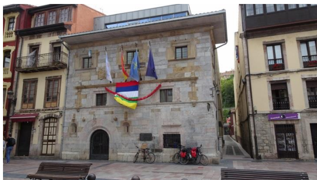
“Ribadesella: Playa de Santa Marina & il Palacio de l'Ayuntamiento

Rientriamo in campeggio e dobbiamo uscire in quanto il “check out” è entro le ore 13,00. Ci parcheggiamo appena fuori dal campeggio ( GPS= N=43°28'04,00" O=05°05'02,60" m. 5 s.l.m. ), dove troviamo anche altri camper in sosta anche per la notte davanti a parecchie abitazioni e dopo pranzo ripartiamo. Per il momento non prendiamo l'autostrada, ma seguiamo la N-632 fino a “ Colunga ” (circa 20 km dal campeggio) dove prendiamo a destra, per costeggiare il mare, sulla AC-257 fino all'autostrada A-8 (E-70), che seguiamo fino a “ Gijón ”,