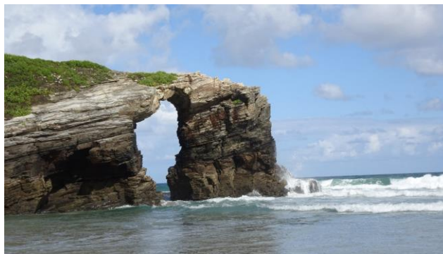
“Playa de As Catedrais”