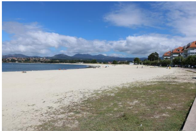
“Baiona: in sosta sulla Playa de Ladeira”

19° giorno 13 agosto 2018 (Visita di Baiona a piedi km 10 + escursione in catamarano alle Illas Cies e spiaggia da Rodes km 28)