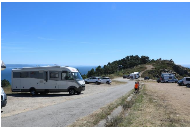
"In sosta al Faro di Finisterre"

A piedi raggiungiamo il punto estremo del capo che rappresenta anche il punto di arrivo del "Camino di Santiago" www.caminodesantiago.gal segnalato da un cippo con evidenziato il chilometro 0,00 e da una croce in pietra dove i pellegrini depositano una pietra come ricordo. In prossimità della struttura del faro c'è anche un hotel con annesso ristorante e terrazza panoramica: l'"Hotel O Semaforo". La zona ovviamente è a forte attrazione turistica e ci sono anche due negozi di souvenir e un bar: il "Bar O'Reuxio", dove vendono anche prodotti locali. All'ingresso della zona pedonale un'altra croce: la "Cruz da Costa da Morte" . Ripercorrendo la strada dell'andata, arrivati sopra il paese di "Finisterre" ci fermiamo per ammirare e scattare qualche foto dall'alto alla lunghissima e bellissima "Praia Langostera" . Non abbiamo tempo di fermarci in spiaggia e quindi proseguiamo nel nostro itinerario. Segnaliamo che poco prima c'è un'area camper (GPS= N=42°54'40,70" O=09°15'49,40" m. 35 s.l.m.). Sempre seguendo la AC-445, arriviamo a "Cee" e poi proseguiamo sulla AC-550 e arriviamo così a "Carnota" dove troviamo la spiaggia più lunga della "Galizia" , ben 7 chilometri ininterrotti di sabbia bianca!