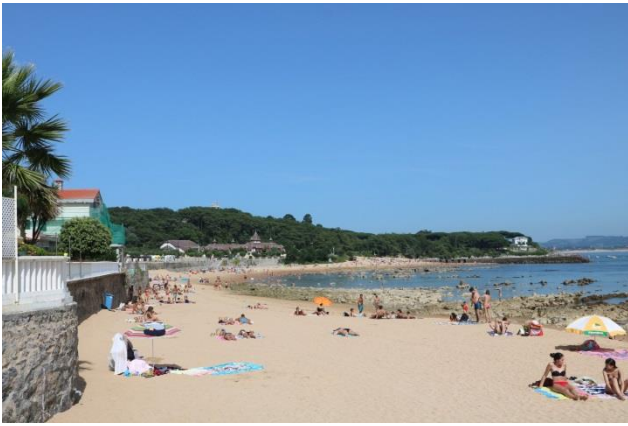
“Santander: Playa de los Peligros”