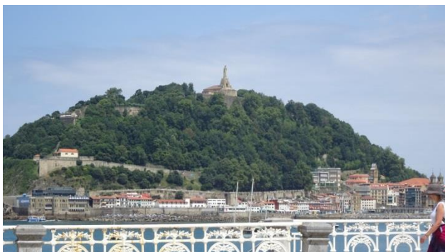
“Il Monte Urgull da San Sebastian”

Ha piovuto quasi tutta notte e questa mattina piove ancora, ma per fortuna verso le 11,30 smette e sembra schiarire, così dopo pranzo scendiamo nuovamente a “Donostia/San Sebastian” e ci dedichiamo all’esplorazione dell’altra altura che fa da sentinella alla baia di “San Sebastian” : il “Monte Urgull” . Arriviamo in fondo alla strada sul “Paseo Nuevo” dove c’è un parcheggio (GPS= N=43°19’29,80” O=01°59’34,60” m. 15 s.l.m.) (si può parcheggiare anche lungo tutto il paseo – tutti i parcheggi sono a pagamento e solo mezzi < 30 q., quindi è un rischio entrare con i camper, abbiamo visto la polizia far le multe ad un gruppo di camperisti).