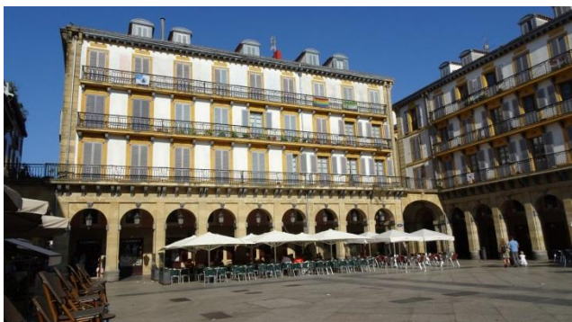
“San Sebastian: Peine del Viento & Plaza Konstituzion”