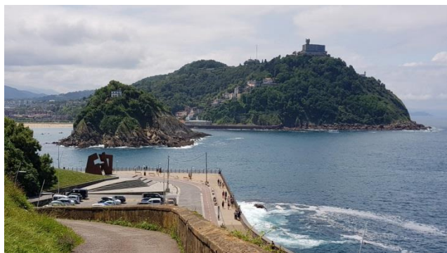
“Monte Igueldo & Isla de Santa Clara”

L'accesso al “Monte Igueldo” è possibile anche con la “Funicolare” , in questo caso occorre prendere il bus N. 16 (fermata fuori dal campeggio) e scendere proprio sul piazzale della “Funicolare” (costo del biglietto € 2,30, come il parcheggio). Questo è un punto panoramico su tutta la “Baia di San Sebastian” ed è anche un grande parco giochi per adulti e bambini, con negozi e ristoranti. Qui tutte le attività aprono dopo le 10,00/10,30 e quindi giriamo indisturbati non essendoci folla. Saliamo anche sulla torre, il vecchio faro a legna (€ 2,50 a persona), a piedi (l'ascensore non funziona) e da questo punto il panorama è decisamente il massimo! Iniziamo la discesa con la strada dalla parte opposta della salita e qui troviamo il nuovo faro; la strada arriva proprio al piazzale della “Funicolare Monte Igueldo” (GPS= N=43°19'08,70" O=02°00'22,60" m. 20 s.l.m.) e proseguendo arriviamo alla “Playa Ondarreta” (GPS= N=43°19'03,10" O=02°00'15,20" m. 0 s.l.m.), dove parcheggiamo lo scooter (qui c'è anche la fermata del bus N. 16).