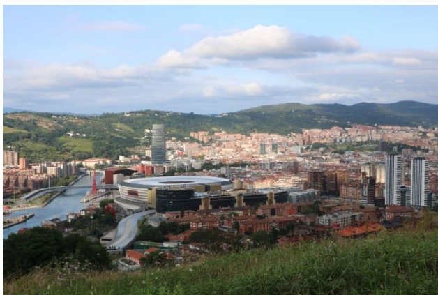
“ Bilbao: panorama ”

Dopo pranzo ci rechiamo in centro per la visita. Fuori dal campeggio c’è la fermata del bus N. 58. Scendendo verso il centro storico ci fermiamo per qualche scatto nella “ Plaza de Toros ” e proseguiamo al “ Ponte de San Antòn ”, davanti alla “ Iglesia de San Antòn ” e al “ Mercado de la Ribera ”, dove parcheggiamo ed iniziamo la visita della città a piedi, infilandoci tra le strette vie del “ Casco Viejo ” con le “ Siete Calles ” (le sette vie della città vecchia). La prima tappa è davanti alla “ Iglesia de los Santos Juanes ” con in fianco il “ Museo Euskal ” (museo etnografico Basco), la seconda tappa è alla “ Catedral de Santiago Apostol ”, che è anche il Santo Patrono della città dal 1643. Costruita nel XV° secolo, ha uno stile gotico, sebbene la sua torre e la facciata siano in stile neogotico. La visitiamo anche all’interno (€ 5,00 a persona).