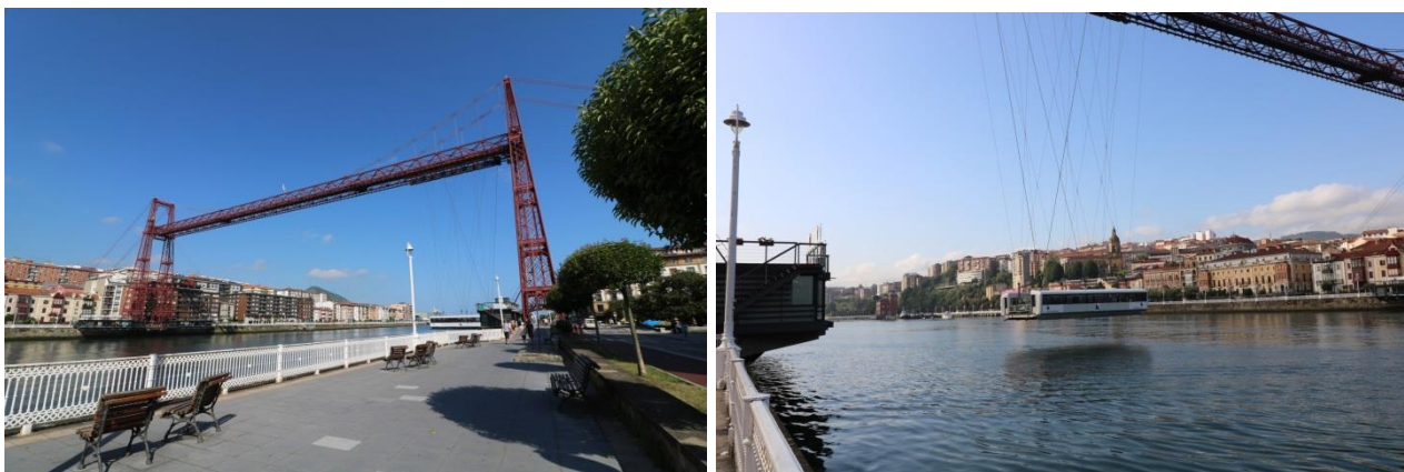
“Bilbao: Puente Vizcaya”

una parte all'altra del fiume (costo per il camper € 2,60 + 0,40 a persona). Facciamo anche una passeggiata sul lungo fiume fino alla foce.