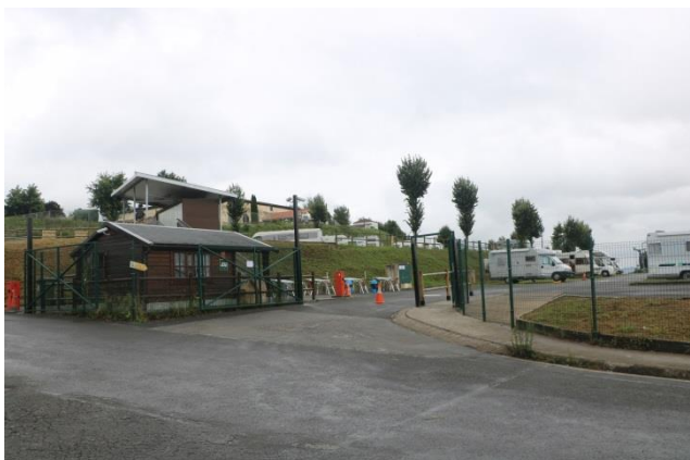
“ Bilbao: area camper ”

Usciamo dal campeggio, scendiamo a “ San Sebastian ” e da qui seguiamo le indicazioni per l’autostrada in direzione di “ Bilbao ” capoluogo della provincia di “Biscaglia” . Imbocchiamo la GI-20 e poi la AP-8 (E-70) fino all’uscita N. 119 di “ Bilbao ” www.bilbaoturismo.net (anche questa città si trova sul “ Camino de Santiago ”) www.absolutbilbao.com e da qui seguiamo la B-636 fino all’uscita N. 5 dove seguiamo sempre a destra in salita (indicazione per l’area camper) fino all’ingresso dell’area. L’area camper è bellissima (€ 15,00 a notte) con più di 100 posti in belle piazzole in piano con carico dell’acqua in piazzola e due punti per carico e scarico, tutte con energia elettrica (GPS= N=43°19’29,80” O=01°59’34,60” m. 15 s.l.m.): “Área de Autocaravanas de Kobetamendi” (e-mail per prenotazioni: kobetamendi@suspertu.net ). Ci sono anche i servizi igienici (NO docce).