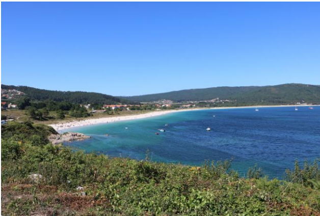
“Finisterre: Playa Langostera”