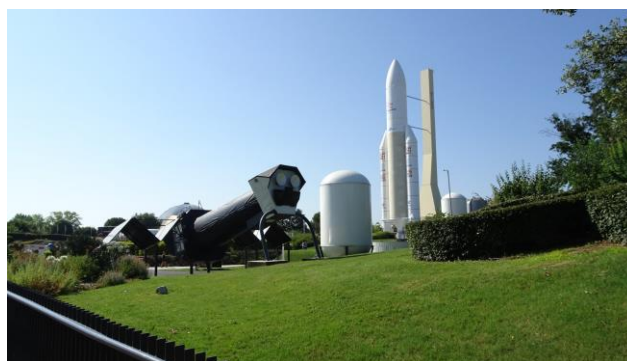
“Toulouse: Cité de l'espace”

Terminata la visita, imbocchiamo nuovamente la A-64 (E-80) che seguiamo fino nei pressi di “ Bayonne ”, dove prendiamo la A-63 (E-5) che ci porterà fino al confine con la “ Spagna ”, dove l'autostrada si chiama AP-1. Da qui seguiamo le indicazioni per “ Donostia/San Sebastian ”. Arrivati in città ci dirigiamo all'area camper segnalata alle coordinate (GPS= N=43°18'27,70" O=02°00'51,00" m. 10 s.l.m.), ma ci rendiamo conto che non è una vera e propria area camper, ma bensì un parcheggio in strada in mezzo alle auto, decidiamo quindi di recarci al “ Camping Igueldo ” (GPS= N=43°18'17,50" O=02°02'45,60" m. 250 s.l.m.), sopra la città. Il campeggio www.campingigueldo.net attrezzato anche con una vera e propria area