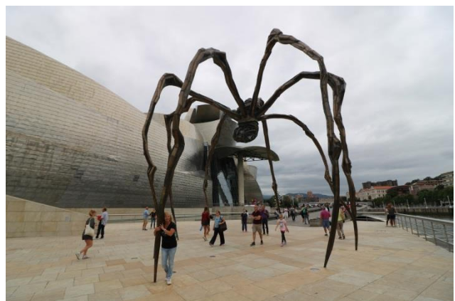
“Bilbao: Guggenheim Museum, ingresso con Puppy e la scultura Maman”