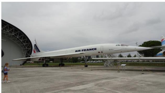
“ AIRBUS: L’ A-400-M & IL Concorde ”

Terminata la visita torniamo con il bus sul piazzale del museo e qui saliamo all’interno dell’ “ A-400-M ” dove assistiamo a un filmato sulle caratteristiche di questo particolare aereo militare. Terminata la visita facciamo un breve giro all’interno della boutique e torniamo allo scooter e ci dirigiamo senza esitazione in centro città per la visita della città. Parcheggiamo così lo scooter nei pressi del centro città e ci addentriamo nella zona pedonale. Iniziamo con “ Place du Capitole ” che purtroppo non possiamo ammirare nella sua bellezza in quanto è occupata completamente da un evento sportivo e quindi anche la facciata del “ Capitole ” è abbastanza coperta. La grande piazza centrale di “ Tolosa ” prende appunto il nome dal grande edificio che si affaccia sulla piazza stessa, oggi sede del “ Municipio ”, costruito tra il ‘700 e il ‘900. Proseguiamo in “ Rue du Taur ” (Via del Toro) con “ Notre Dame du Taur ” che visitiamo anche all’interno, quindi ci avviamo verso la “ Garonna ” e ci fermiamo al “ Convento Les Jacobin ”, che ammiriamo anche all’interno, con il soffitto che ha l’effetto di grandi palme. Ancora poco e arriviamo in “ Place St. Pierre ” di fronte all’omonimo ponte sulla “ Garonna ”, qui ammiriamo, solo dall’esterno in quanto chiusa in ristrutturazione, la “ Chiesa di St. Pierre ”.