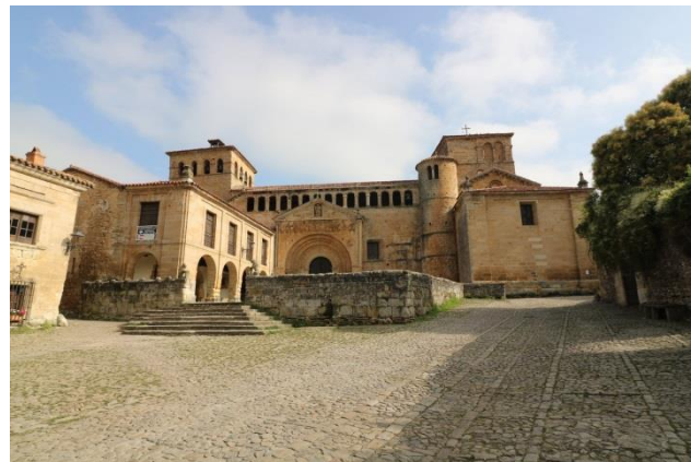
“Santillana del Mar: Casco Historico & a Collegiata”

Rientriamo così al campeggio perché il check-out è alle 13,00. Usciamo dal campeggio e seguiamo la CA-131 in direzione “Comillas” dove abbiamo previsto di fermarci ( queste sono le coordinate del parcheggio idoneo anche per una sosta notturna: (GPS= N=43°23’14,10” O=04°17’14,00” m. 35 s.l.m.) ), ma è sabato e i parcheggi sono tutti completamente pieni quindi non riusciamo a parcheggiare, per cui proseguiamo e ci fermiamo per pranzo nel parcheggio ( GPS= N=43°22’55,40” O=04°19’09,10” m. 15 s.l.m. ) del “Parque Natural de Oyambre” con vista sulla bella spiaggia. Riprendiamo il nostro cammino e, appena passato il ponte sulla laguna, giriamo a destra, per seguire la costa sulla CA-236 e possiamo così