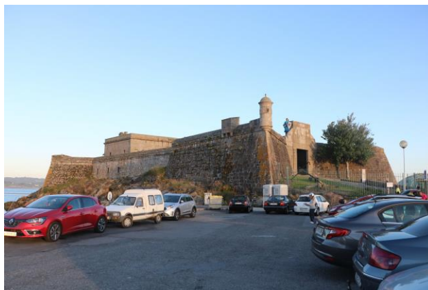
“A Coruña_Castillo de San Antòn”

17° giorno 11 agosto 2018 (A Coruña – Camariñas – Finisterre – Muros km 196 e a piedi km 7,5)