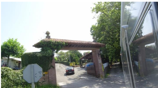
“ Camping Santillana del Mar ”

ammirare tutta la bellissima “ Playa de Oyambre ” (qui ci sono anche 3 campeggi) e poi la “ Playa de Meron ”, entriamo così a “ San Vicente de la Barquera ” dove ci innestiamo N-634.