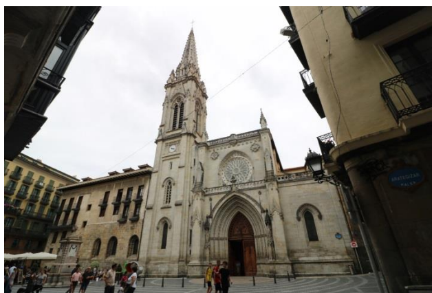
“ Bilbao: Mercado de la Ribeira & Catedral de Santiago Apostol ”