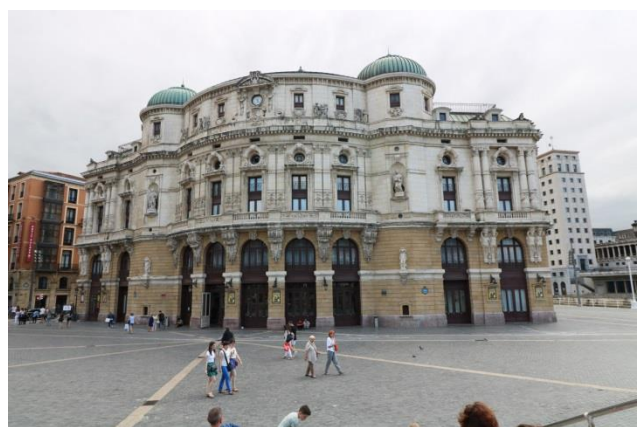
"Bilbao: Estacion Concordia & il Teatro Arriaga"

8° giorno 2 agosto 2018 (Bilbao – San Juan de Gaztelugatxe – km 108 in moto e km 5,80 a piedi)