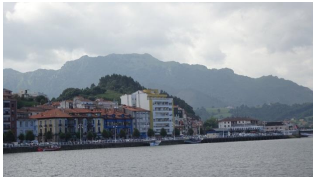
“Ribadesella: Campig Playa Sauces & Panorama della città”