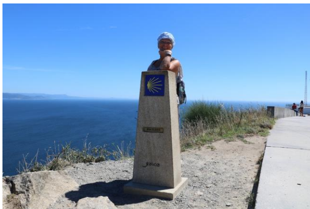
"Fine del Camino de Santiago: Finisterre"

A piedi raggiungiamo il punto estremo del capo che rappresenta anche il punto di arrivo del "Camino di Santiago" www.caminodesantiago.gal segnalato da un cippo con evidenziato il chilometro 0,00 e da una croce in pietra dove i pellegrini depositano una pietra come ricordo. In prossimità della struttura del faro c'è anche un hotel con annesso ristorante e terrazza panoramica: l'"Hotel O Semaforo". La zona ovviamente è a forte attrazione turistica e ci sono anche due negozi di souvenir e un bar: il "Bar O'Reuxio", dove vendono anche prodotti locali. All'ingresso della zona pedonale un'altra croce: la "Cruz da Costa da Morte" . Ripercorrendo la strada dell'andata, arrivati sopra il paese di "Finisterre" ci fermiamo per ammirare e scattare qualche foto dall'alto alla lunghissima e bellissima "Praia Langostera" . Non abbiamo tempo di fermarci in spiaggia e quindi proseguiamo nel nostro itinerario. Segnaliamo che poco prima c'è un'area camper (GPS= N=42°54'40,70" O=09°15'49,40" m. 35 s.l.m.). Sempre seguendo la AC-445, arriviamo a "Cee" e poi proseguiamo sulla AC-550 e arriviamo così a "Carnota" dove troviamo la spiaggia più lunga della "Galizia" , ben 7 chilometri ininterrotti di sabbia bianca!