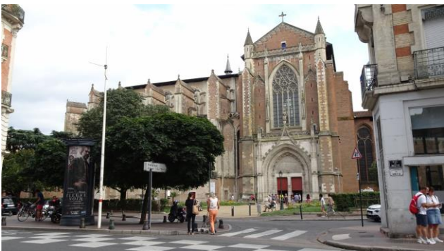
“ Toulouse: Place du Capitole e la Cathédrale de St. Étienne ”