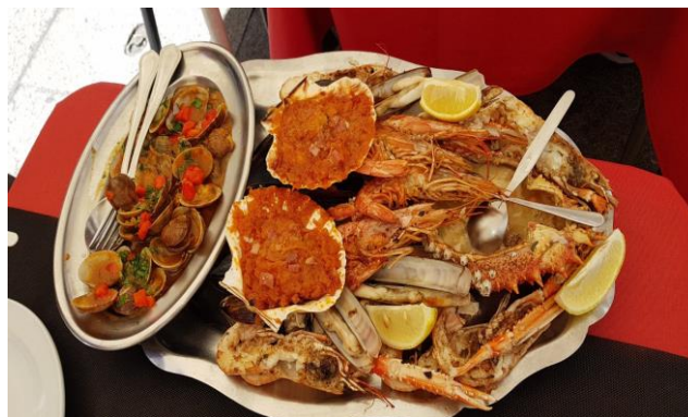
“Baiona: Parilada de Mariscos”

20° giorno 14 agosto 2018 (Baiona – Canyon do Sil – Leon km 429 + km 26 in catamarano nel Canyon do Sil)