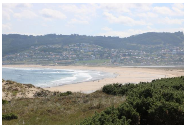
“Praia da Frouxeira”