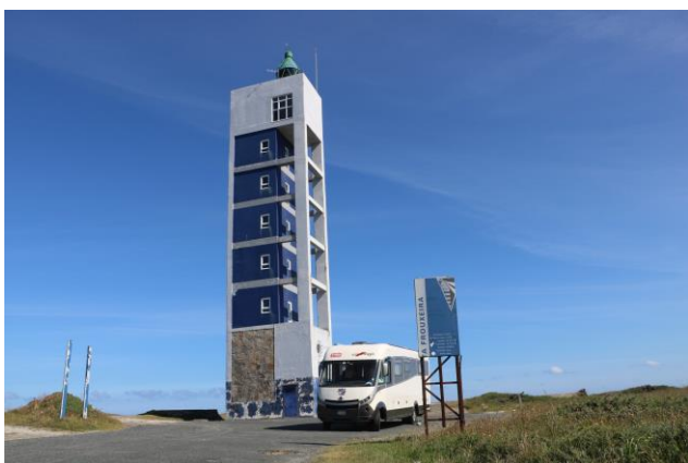
“Faro de Punta Frouxeira”

Tempo bellissimo, poco dopo le 9,00 ci mettiamo in marcia in direzione di “A Coruña” , capoluogo della omonima provincia, sempre in “Galizia” . Riprendiamo la LU-862 che diventa ben presto AC-862 che percorriamo fino al punto in cui inizia l'autostrada CG-1.3 che percorriamo completamente (anche questa è una bretella che ci permette di evitare un pezzo di strada ordinaria). Al termine ci immettiamo sulla AC-101 che in pochi chilometri ci riporta sulla AC-862 che seguiamo fino a “Cerdido” dove prediamo a destra sulla AC-102. Procediamo su questa strada fino al termine della stessa e all'innesto con la AC-566 che seguiamo fino ad una rotonda con l'indicazione sulla destra per il “Faro de Punta Frouxeira” .