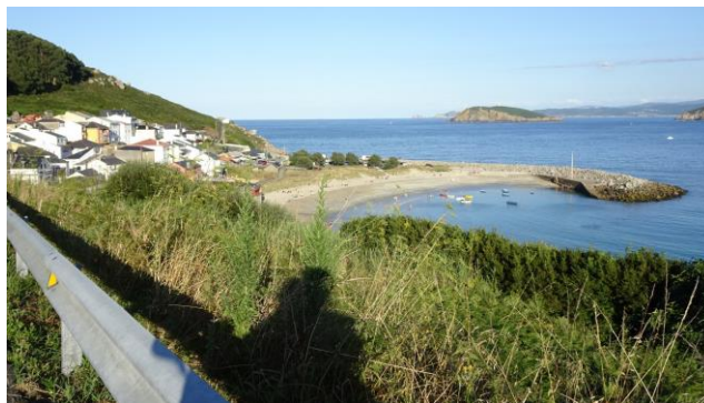
“Praia de Bares”

Era in uso fino alla fine degli anni '60. Più tardi, alla fine degli anni '90 e all'inizio del secolo attuale è stato riabilitato, diventando un “Hotel de Naturaleza” dove la pietra è combinata con il legno in tutte le parti dell'Hotel e la natura vivente in tutto il suo contorno è ciò che raggiunge la vista. È stato inaugurato il 15 agosto 2002. Scendiamo e raggiungiamo la “Praia de Bares” , una bella spiaggia con parcheggio anche per i camper, ma esplicito cartello: sosta notturna vietata. Ritorniamo così, dopo questa intensa giornata al “Porto di Vicedo” , dove passiamo la notte.