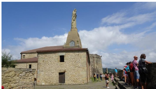
“Il Monte Urgull e il Castillo de la Mota”