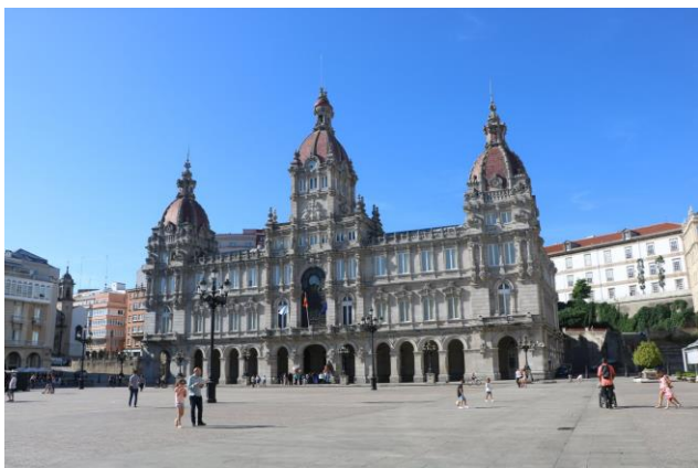
“A Coruña_Plaza Maria Pita”

coraggio infuso ai soldati permise di mettere in fuga e sconfiggere il nemico) e il “ Palacio Municipal ” un bellissimo edificio del 1914, adibito a museo e visitabile con la sua collezione di orologi dal XVIII al XX secolo. Una grande piazza quasi completamente porticata, sulla quale si affacciano palazzi e alberghi con bellissimi “ balconi galiziani ”. Camminiamo un po’ per le viuzze pedonali del “ Casco Historico ” e passiamo davanti anche al “ Teatro Rosalia de Castro ”. Ci fermiamo in un locale per la cena e rientriamo verso la marina, passando dal “ Castillo de San Antòn ” (costruito nel XVI secolo da Felipe II su una piccola isola rocciosa a difesa del porto, dal 1968 è sede del “ Museo Archeologico e Storico ”), che non possiamo visitare in quanto chiude alle 21,00. Buona notte.