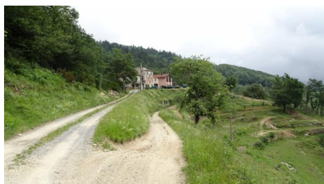
“Rocche Bianche e il cascinale”

Qui incrocio la strada sterrata che sale da “Vezzi” e proseguo con varie deviazioni fino ad “Altare” con parecchi escursionisti in MTB. Anche qui foto di rito e riprendo il cammino per completare il giro ad anello; spalle al monumento, seguo la strada a destra e al primo bivio ( a pochi metri) segua sempre la sterrata sulla sinistra in leggera salita, trascurando la strada che diventa asfaltata verso “Vezzi”. Passo davanti ad un cascinale e appena passato lo stesso seguo in leggera salita sulla sinistra, ma anche se seguissi verso destra, non ci sarebbe problema in quanto strada sterrata e sentiero si uniscono più avanti ad un quadrivio. Al quadrivio giro a sinistra e proseguo su strada sterrata; credo che ormai sia ora di pranzo e