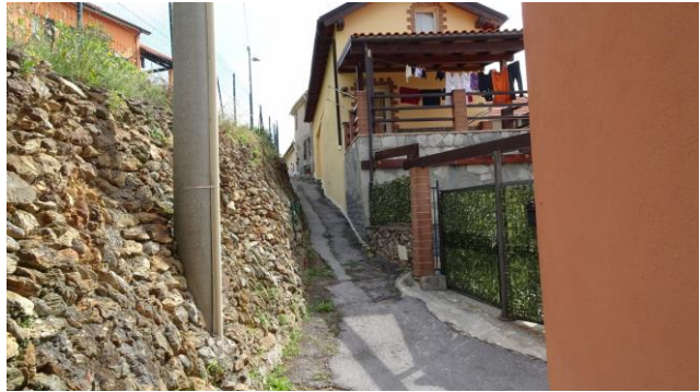
“Il sentiero in mezzo alle case”