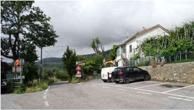
“Cunio: il parcheggio”

Oggi la giornata non è delle migliori, infatti ci sono nuvole basse. Ci troviamo ancora una volta sui monti della “ Liguria ”, nel savonese. Arrivati a “ Cunio ”, frazione di “ Segno ”, troviamo un parcheggio per circa 15 auto (GPS N=44°15'15,80 E=08°22'29,20” 330 m s.l.m.). Ci dirigiamo sull’asfalto proseguendo sulla strada davanti a noi per circa 80/90 metri e sulla destra inizia un sentiero in cemento tra le case.