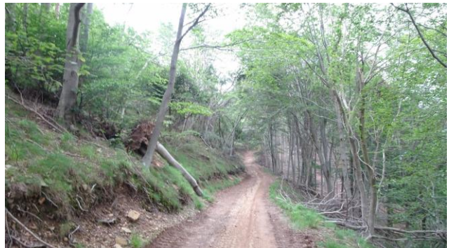
“Il punto panoramico a quota 660 m s.l.m. e la strada sterrata verso la Rocca dei Corvi”