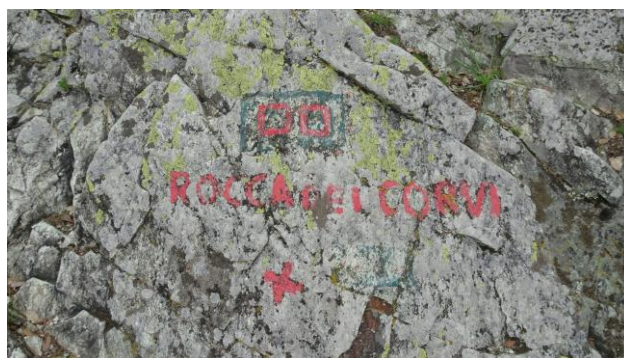
“Rocca dei Corvi 792 m s.l.m.”

Proseguo seguendo sempre la sterrata dove trovo la nuova simbologia: un più rosso, passo per “Rocca dei Corvi Sud” fino a trovare sulla destra l’imbocco di un sentiero, dopo circa 20 minuti di cammino a quota 705 m s.l.m.. Imbocco il sentiero in discesa fino ad una grande vasca, credo dell’acquedotto (GPS N=44°15'13,00 E=08°20'42,10” 660 m s.l.m.). Aggiro la vasca sulla destra (segnavia punto/linea rosso e più rosso) ed entro nuovamente nel bosco, sempre in forte discesa, fino a sbucare nuovamente su una sterrata e in breve arrivo alle “Rocche Bianche” dove è il “Monumento alla Resistenza” (GPS N=44°15'11,20 E=08°20'25,60” 600 m s.l.m.).